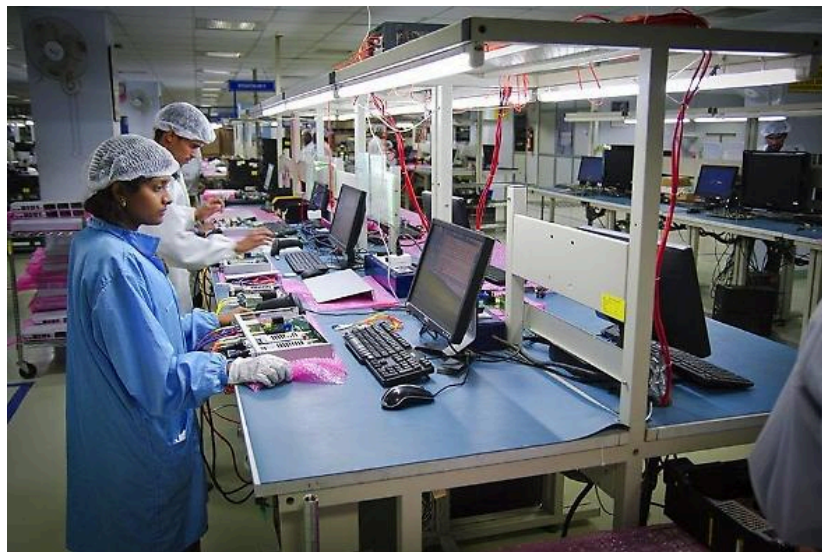
Produzione di apparati elettronici del gruppo Elemaster