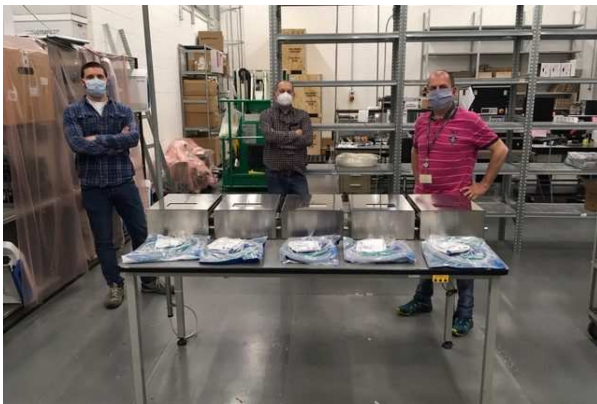
MVM, primi 5 prototipi a Elemaster