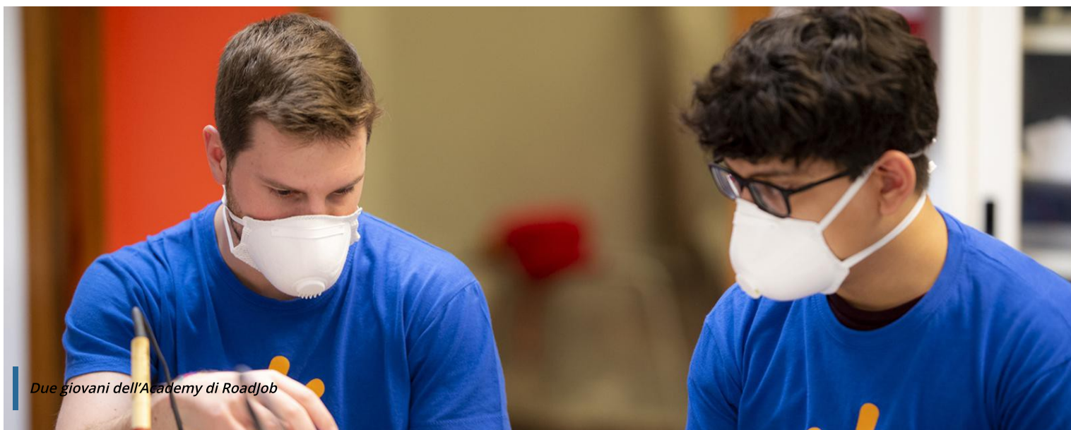
Due giovani dell'Academy di RoadJob