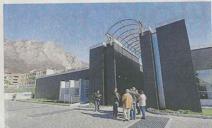
La sede camerale ospiterà l'incontro sui brevetti

esempio l'inserimento alle porte di un capannone ottenendo così un allarme a costo ridotto. La stessa cosa accade ad esempio mettendo, in un garage, un lucchetto a più veicoli che sfruttano un solo comunicatore». Il brevetto - conferma Maggi - è stato realizzato con le sinergie e le competenze lecchesi e rappresenta, per Maggi ed Eletech, la seconda collaborazione dopo la fortunata intuizione, anch'essa brevettata da Maggi, di Selfmatic, dedicato all'avvanzata non assistita di prodotti a misura lineare e ora in piena commercializzazione nei centri bricolage italiani ed europei. ■ M. Del.