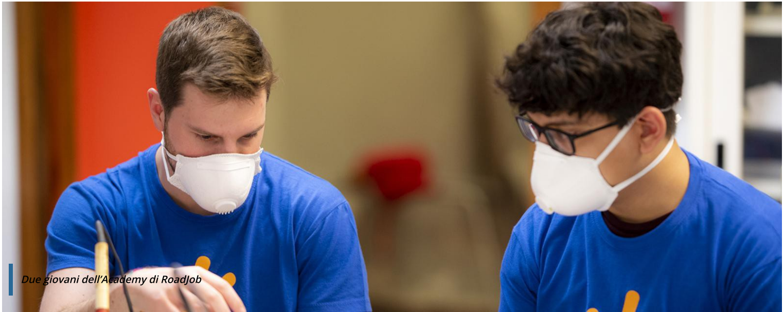
Due giovani dell'Academy di RoadJob